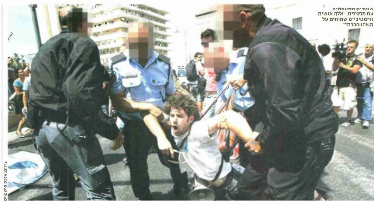
שוטרים מתעמתים עם מפגינים. "אלה אנשים נורמטיביים שמוחים על משהו חברתי"